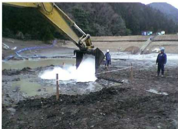
ソイルセーフ®散布状況