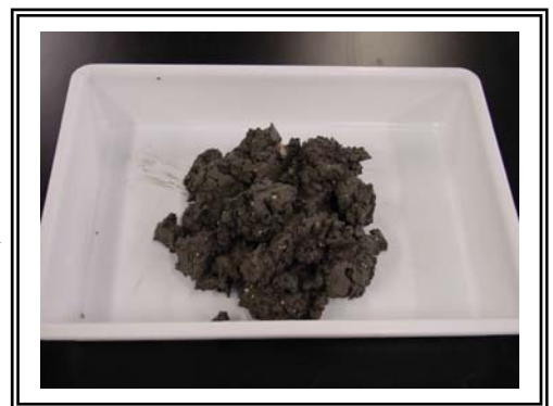
改質土 (ソイルコート1 kg/m 3 使用)